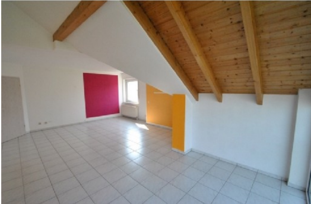
Essbereich mit hohen Decken