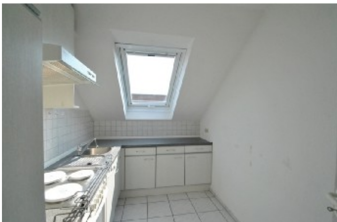
Küche mit Markengeräten