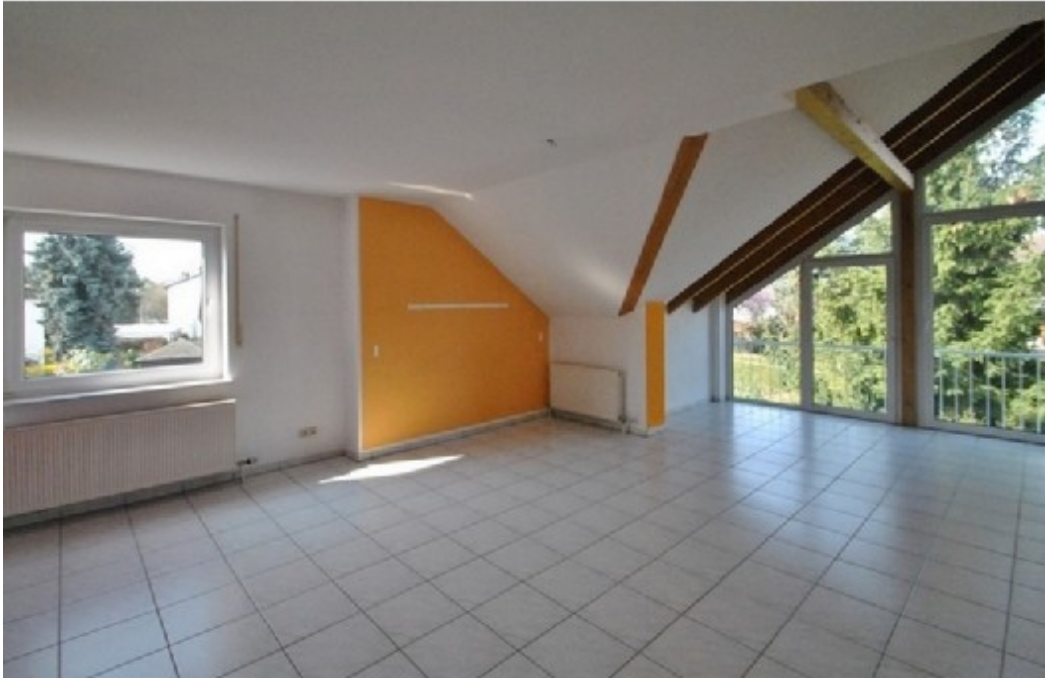
Wohnzimmer mit Möglichkeit für eine Loggia